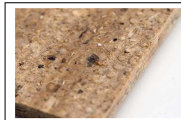
FlatCOR – Platte